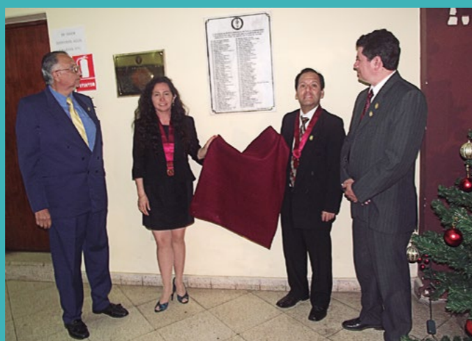
Develando la placa en homenaje a miembros fundadores de la institución.