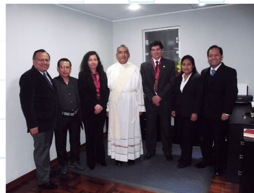
Posando en uno de los ambientes de las secretarías.