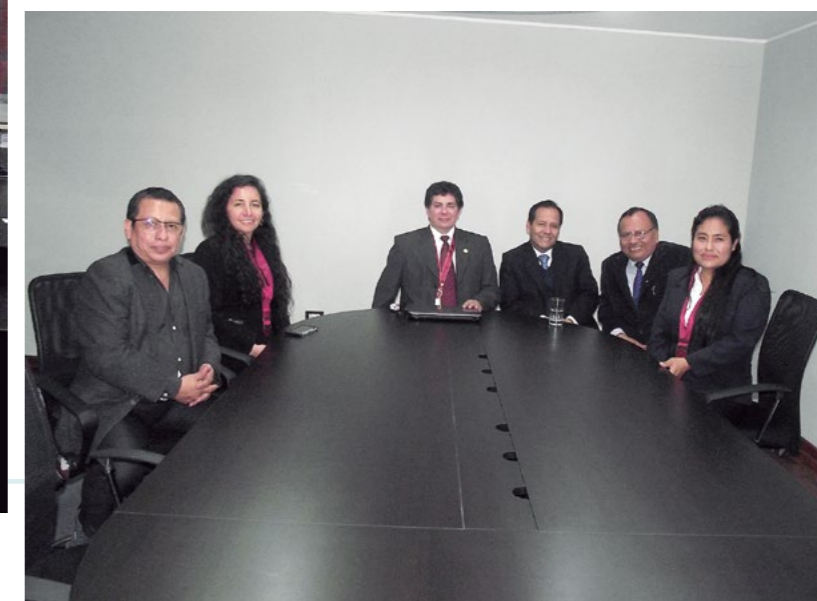
Sala de sesiones del Consejo.

Se pudo apreciar la modernización de los ambientes, tanto de la Sala de Sesiones del Consejo como de las oficinas de la recepción, dotándoles de un mejor visual, mayores comodidades e implementación tecnológica, condiciones necesarias para una mejor atención a los colegiados que concurren a nuestro local.